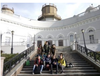
Ребята на фоне здания кафедры