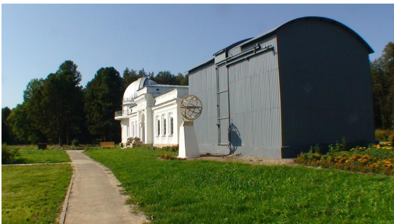
Астрономическая обсерватория им.В.П.Энгельгардта